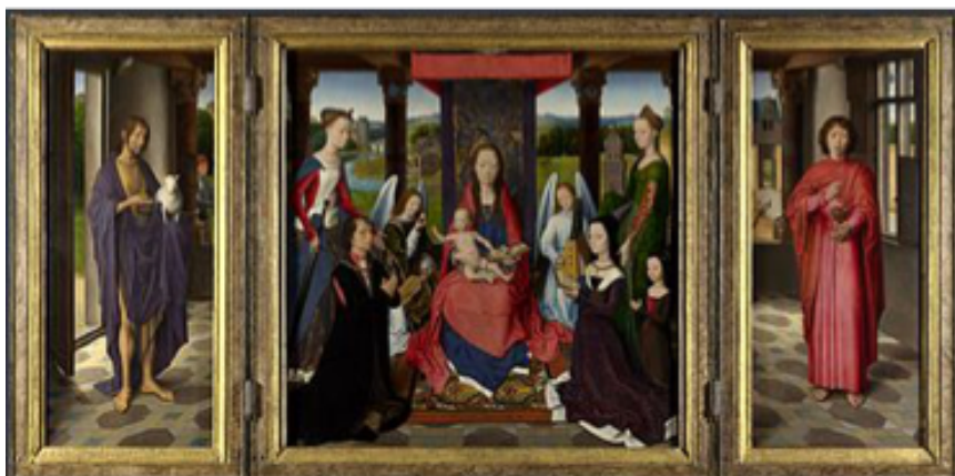
MEMLING Hans Triptyque de John Donne, 1478

Les grands tableaux d'histoire, qui sont un genre en peinture, comme le portrait ou le paysage, ont souvent de très grandes dimensions. Le radeau de la Méduse de Théodore GÉRICAUT , daté de 1818-1819, mesure 491 x 716 cm, Musée du Louvre, Paris, France.