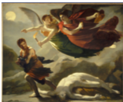
PRUD'HON Pierre Paul La justice et la vengeance divine poursuivant le crime 1815-1818