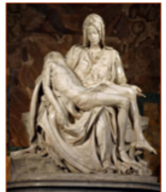
MICHEL ANGE Pietà, 1499