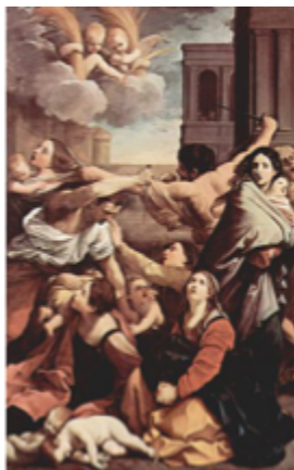
RENI Guido Massacre des innocents, 1611