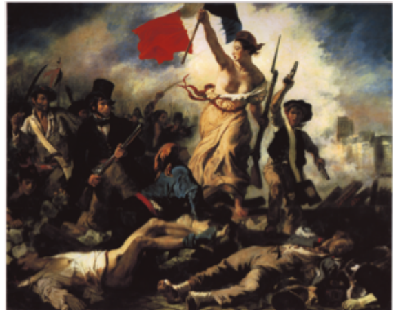
DELACROIX Eugène La Liberté guidant le peuple, 1830

Le regard est dirigé vers le sommet, où se trouve souvent une figure mise ainsi en évidence.