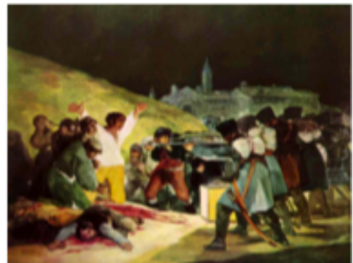
DE GOYA Francisco Tres de Mayo, 1814