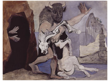
Minotaure et jument morte devant une grotte face à une jeune fille au voile, 1936. Gouache et encre de Chine 50 x 60 cm, Musée Picasso Juan-Les-Pins

Le Cubisme : déformation de l'espace et des corps et multiplication des points de vue