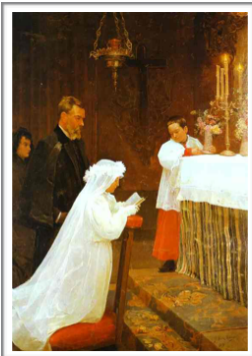
première Communion, 1895-96. Représentation réaliste.