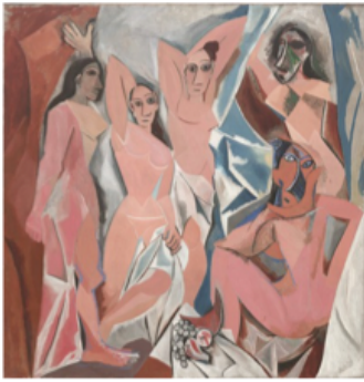
Les demoiselles d'Avignon, 1907 huile sur toile, 243,9 x 233,7 cm, MoMA, New York